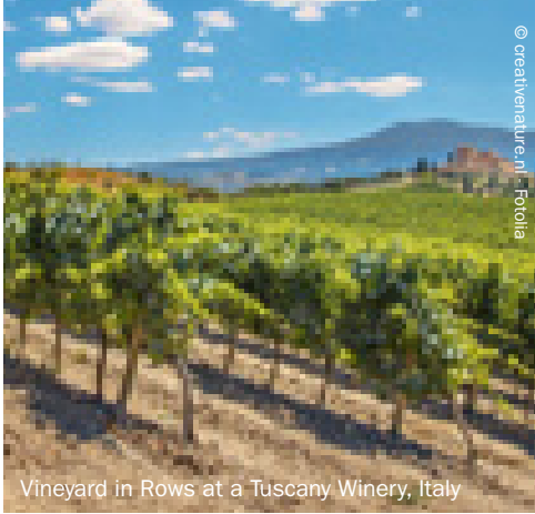
Vineyard in Rows at a Tuscan Winery, Italy